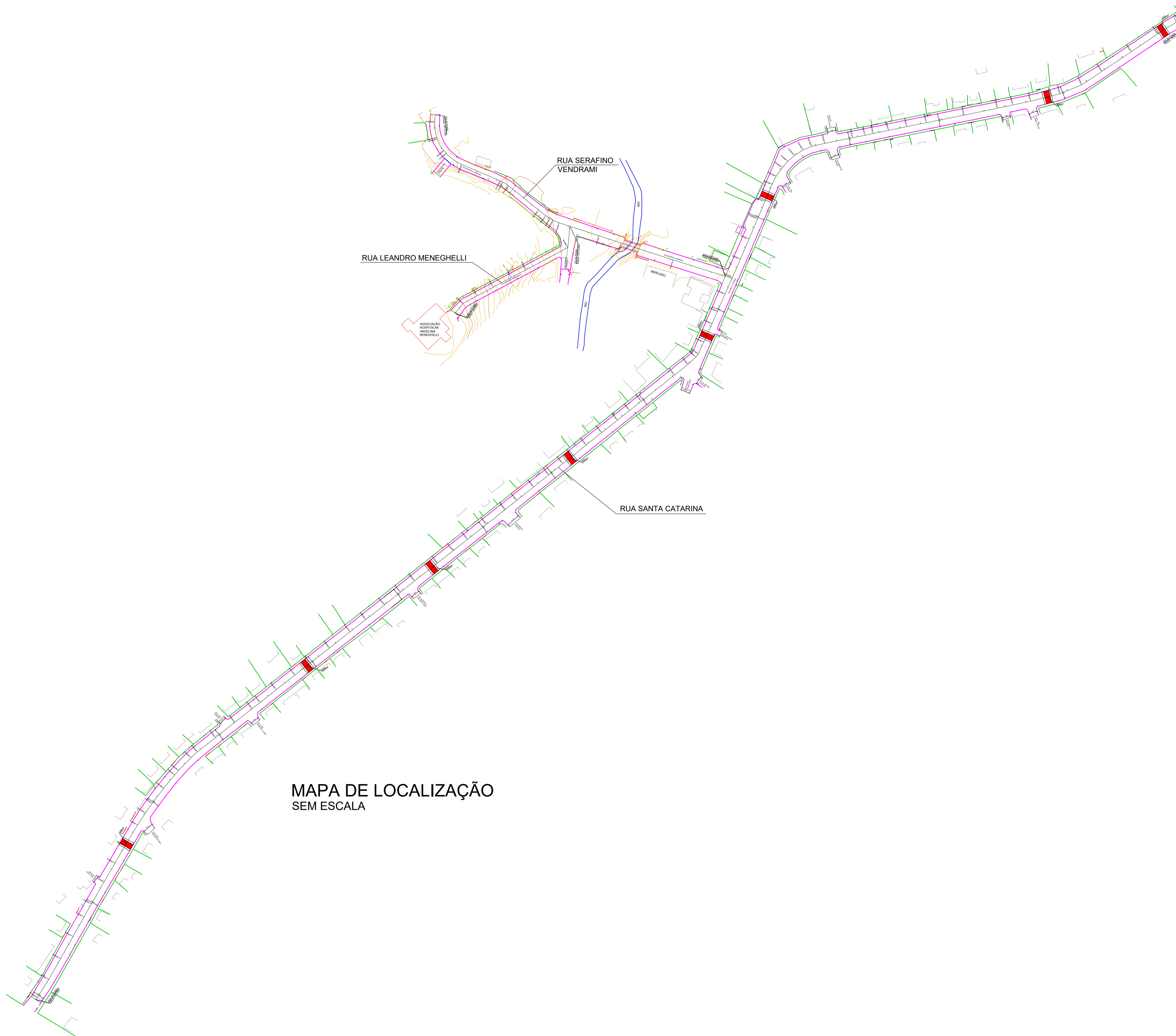
MAPA DE LOCALIZAÇÃO SEM ESCALA