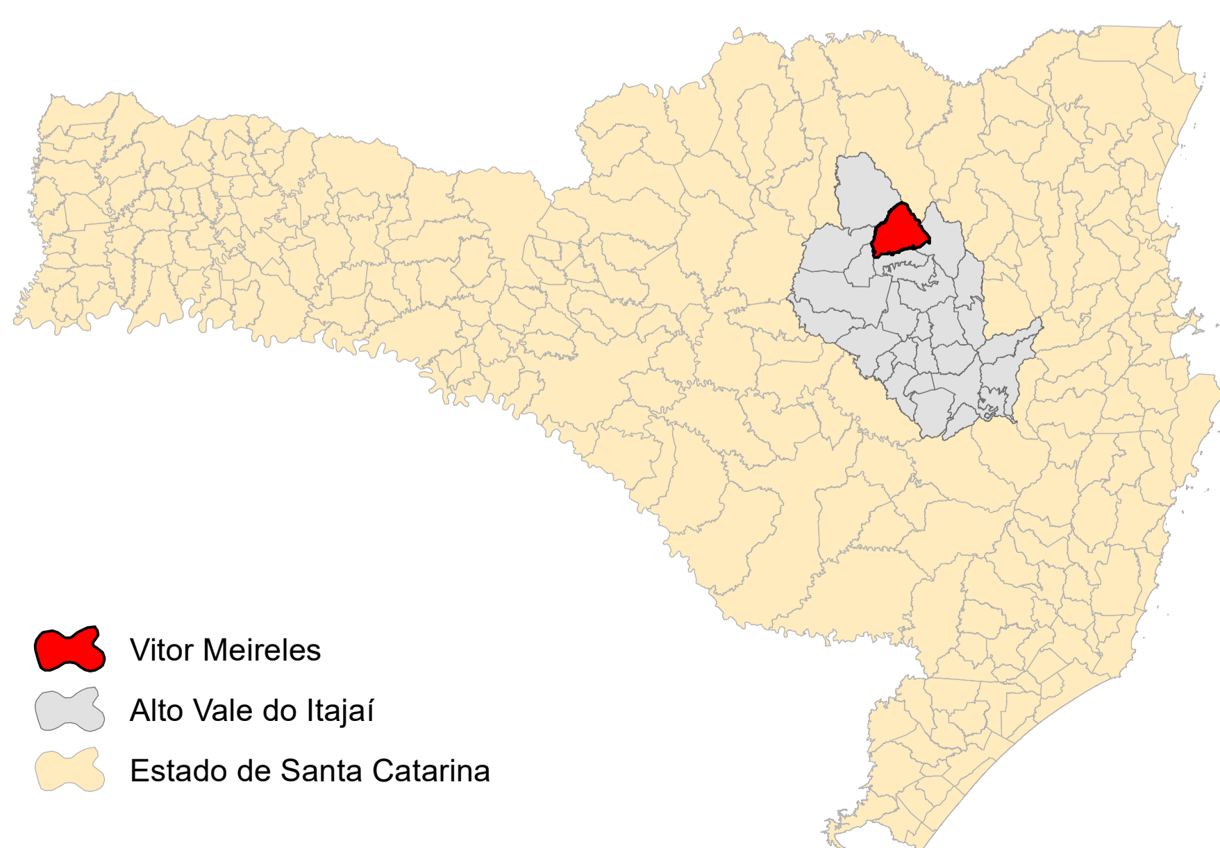
Mapa de Localização