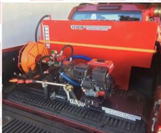
Modelo CVCIF 6 (Capacidade de 600L)